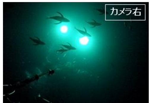
図1 ステレオカメラによる観測（片側）

メバチ小型魚混獲回避のため、前年までに引き続いてイルカ型ソナーによる魚種判別・魚体長推定の精度向上に取り組んだ。今年度はステレオカメラを導入し、イルカ型ソナーで音響情報を得た同一の魚群について、画像による魚種・サイズ識別を試行した。上向きカメラによる画像ならば胸鰭の形状などからカツオをマグロ類（キハダ・メバチ）と識別できることが分かった（図 1）。このようなデータセットを蓄積することでイルカ型ソナーの音響信号から魚種・サイズを推定する精度が向上し、引いてはメバチ小型魚の保護につながることを期待される。